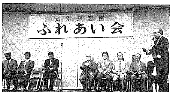
いよいよ開会です！！