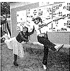
見事なタップダンスの飛び入りです。