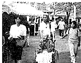
空いてる席はありますか？