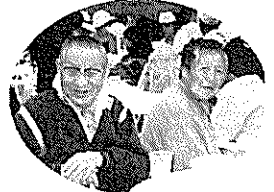
今日は楽しい うれしい日。皆んなニコニコ！