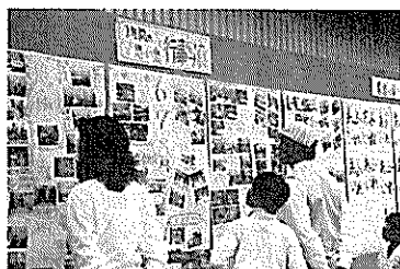
あつ、うちのバアちゃん、写ってる！！