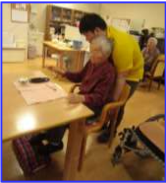
椅子への座りかえ