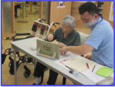
学習の時も椅子へ