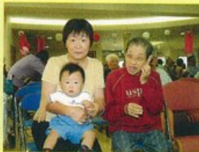
ひ孫さんとチーズ!!