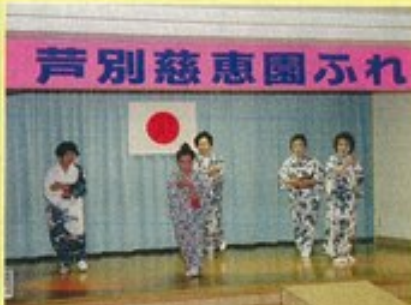
老人クラブ連合会の皆さんの 演芸発表