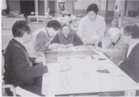
貼り絵2日目。 顔はほとんどできました。