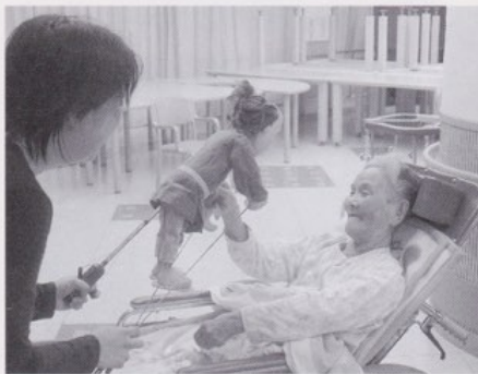
与ひょうさん「コンニチワ」

ら水田の手伝いをしてました。農家は大変でしたが頑張っていました。娘時代、冬に近くの学校にお裁縫を習いに行きました。着物を縫うのが楽しみでした。