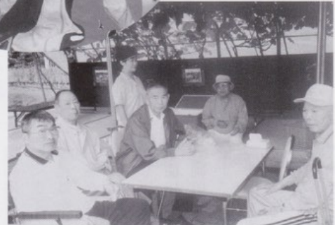
花しょうぶ園見学。 ちょっと小休止