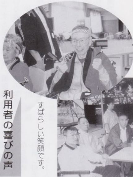
利用者の喜びの声

当センターは、今年4月1日オープン以来、約9ヶ月が経過しました。一日の利用定員は20名で、9月から各曜日ともほぼ満員で、登録者は89名、実利用者75名、入院・長期休止者9名、待機者4名となっています。これらの数字は、オープンから9ヶ月の施設としては、利用が好調なことを示していると思われれます。