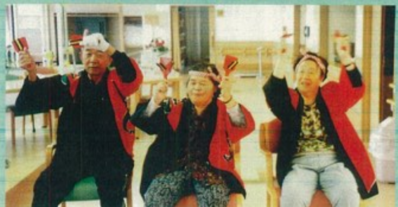
みんなてYOSAKOI 月マーレンソーラン♪