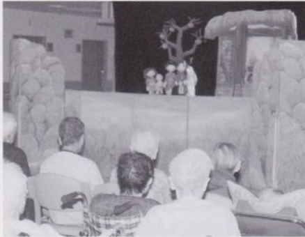
人形劇杉の子財団「夕鶴」を鑑賞

私は新潟生まれの小樽育ちです。小樽の実家は野菜や果物を扱う商店でした。大きな家で、人も使ってたから手伝ったこともなかったですよ。私は量徳尋常高等小学校に通っていましたが、戦時中は挺身隊として戦闘機の油を入れるゴムタンクを作りに行きました。嫁に来るまで米の炊き方や裁縫も知らなかったですよ。小樽に居た頃は遊んで遊んで、朝から晩まで映画を見てる日もありました。夫とはお見合いでたった1回しか会わないで結婚しました。母は3人の子どもの末っ子だからやりたくなかったみたいだね。芦別には戦後すぐの昭和21年に来ました。当時の芦別の駅前はずいぶん寂しく感じましたよ。トラック1台分の荷物を持って小樽から来たけど、稼ぎの