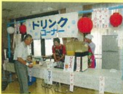
ドリンクコーナーで一杯