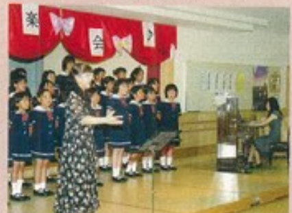
芦別こども合唱団の 可愛い歌声にウツトリ!!