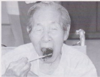
おいしい特製オハギですよ