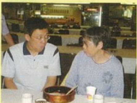
「私のお寿司食べたでしょ？」 「くれるって言ったじゃないですか」