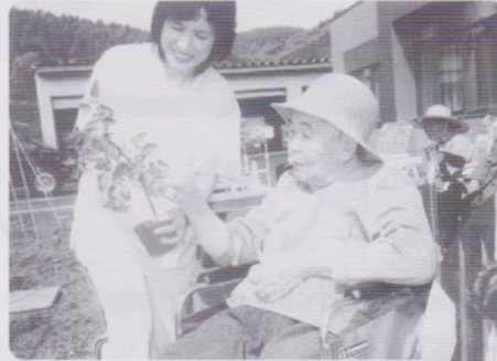
皆さんで苗植え！これにしようかな？