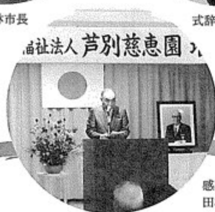
社会福祉法人 芦別慈恵園 入