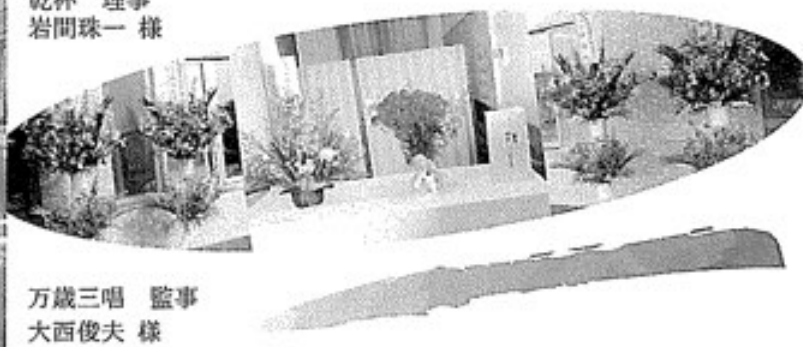
万歳三唱 監事 大西俊夫 様