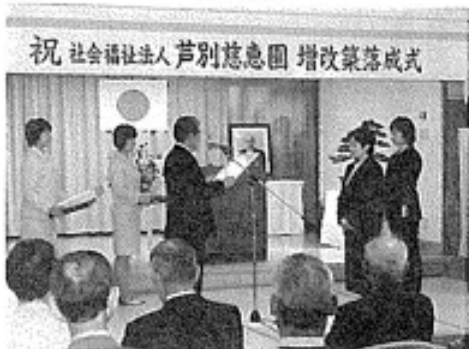
祝 社会福祉法人 芦別慈恵園 増改築落成式