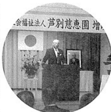
社会福祉法人 芦別慈恵園 増