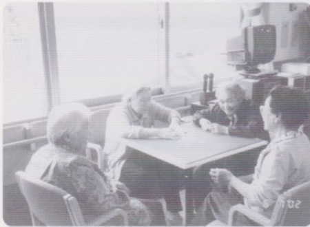
このメンバーでいつもの花札です。