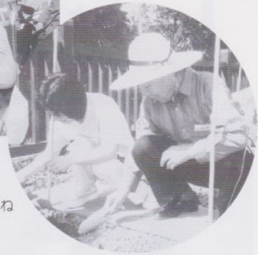
しっかり土をかけてね