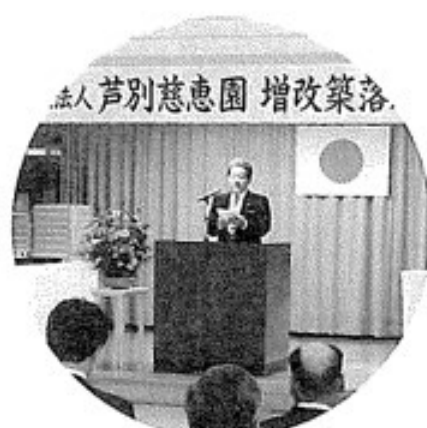
社会福祉法人 芦別慈恵園 増改築落