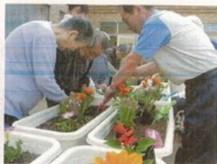
好きな花を植えました。 手入れが大変だけど楽しみですネ