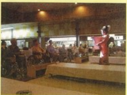
きれいな着物姿にウツトリ!! どっちが美味しいカナ?