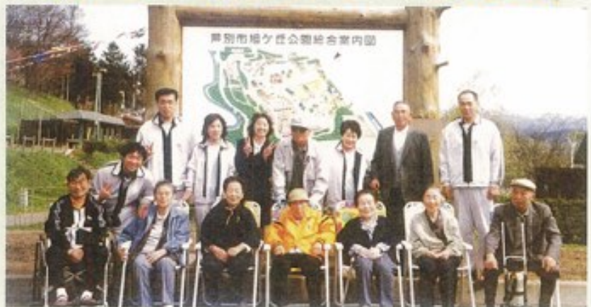
旭ヶ丘公園のサル山見学にも行きました。