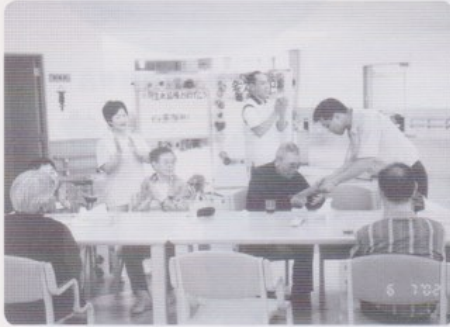
お誕生会。職員手作りの誕生カードをプレゼント！

利用者の皆さんからは、「楽しかった。いいお風呂だった。また来ます。」など喜びの声がたくさん聞かれます。