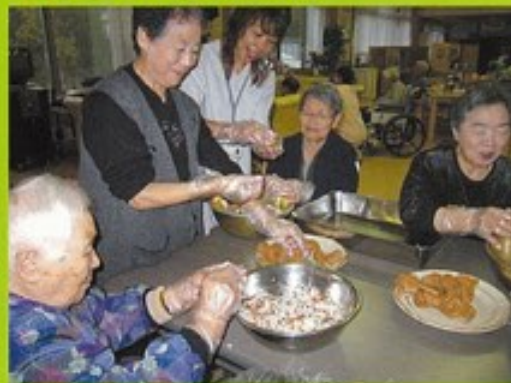
稲荷寿し、上手に出来ました!