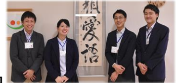
芦別慈恵園 生活相談員チーム