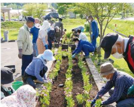
マスク着用での花壇整備

全国的には緊急事態宣言が解除されていますが、芦別慈恵園としましては当分の間、この対策を継続してまいりますので、どうかご理解とご協力をお願いいたします。