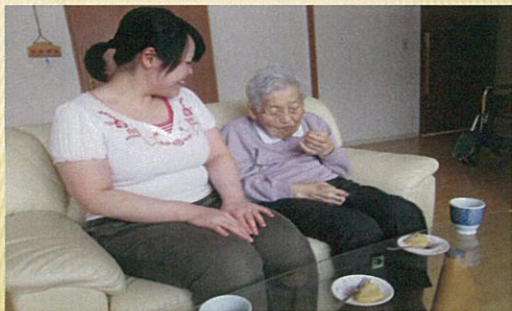
スタッフとお茶を飲んで一息