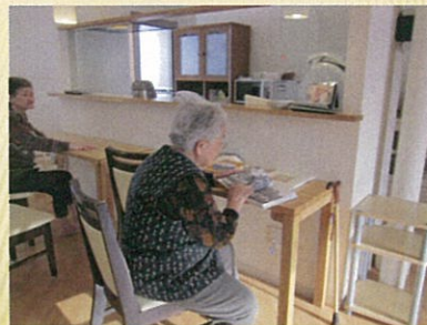
毎回本を借りての楽しみ