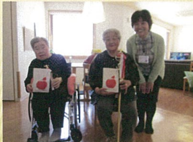
相撲で頑張り表彰されました