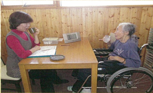
コロちゃん(月曜日 10:00~)