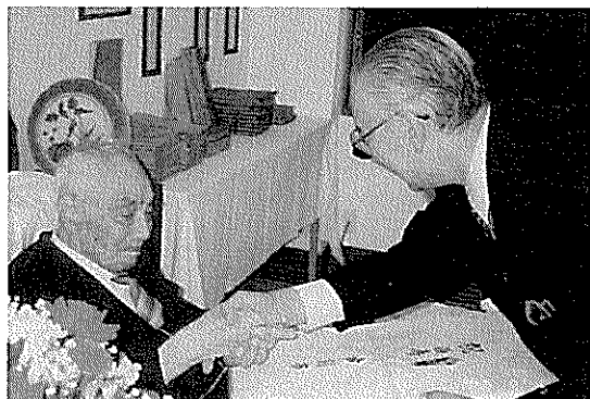
▲満100才のお誕生日の さん 明治、大正、昭和、平成の時代に生きています!!