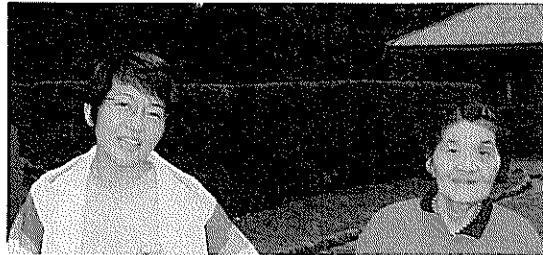
▲帰りは日本庭園で散歩 看護婦さんとツーショット!!