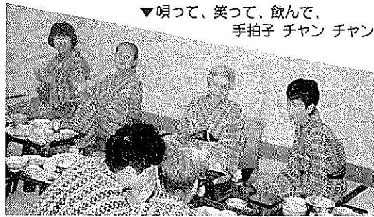
▼唄って、笑って、飲んで、手拍子 チャン チャン