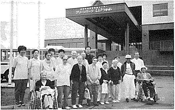
▲一泊旅行で新十津川へ いーお湯だったネ。