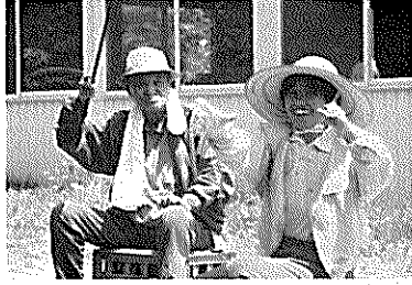
▲釣れた、釣れた!! かわいいのが……。