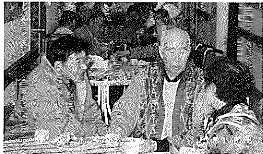
▲息子さんと一緒に