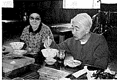
▲あたしが釣った魚はオイシイよ。