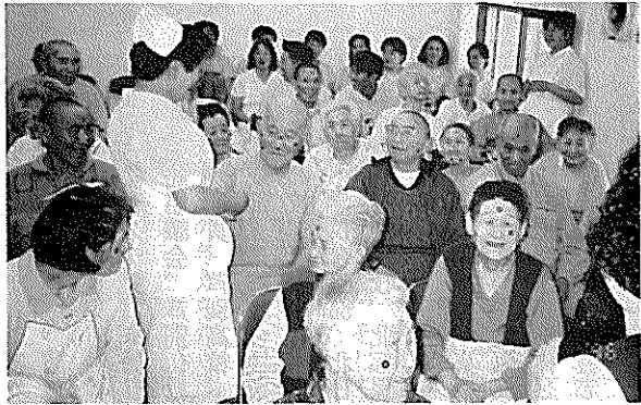
▲健康講座でほくろゲーム、みんな似合うネ。