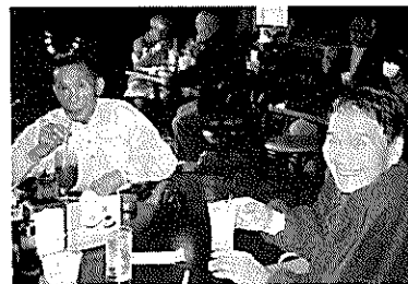
▲買い物のおあとは、お茶しましょ!