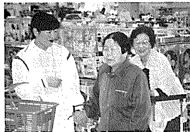
▲ニッショウマートへお買い物、たくさん買いましたか?