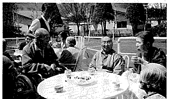
▲お茶のおかわりドーですか?