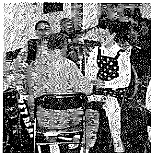
▲ウェイターさんもひと休み