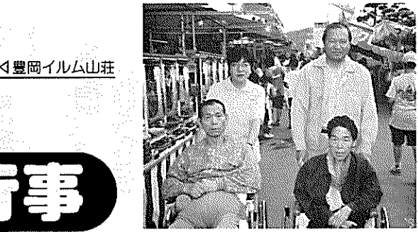
▲夏越し祭り見物に行ったヨ。