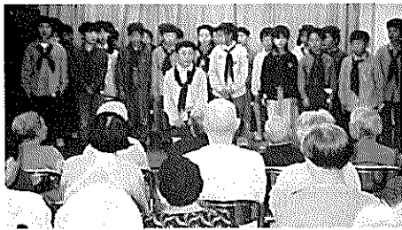
▲緑小児童の皆さん 赤いスカーフがステキです。