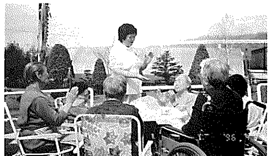
▲天気がいいから唄を一曲