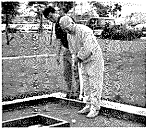
▲さまになってる ゴルファーぶり